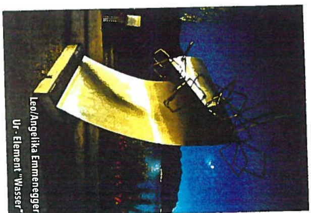
Leo/Angelika Emmenegger Ur - Element "Wasser"