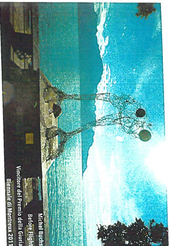
Mitchell Buchs Betofre Flight Vincitore del Premio della Giuria Biennale di Montreux 2011

Alcune immagini delle opere presenti alla Biennale di Montreux 2015. Tutte le foto sono © Libereamenti