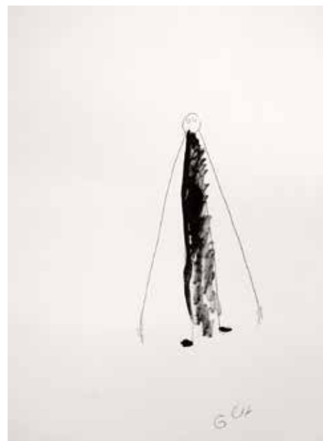
Guy Vonlanthen Sans titre 40 x 40 cm

Dirigé par des plasticiens professionnels, l'atelier tient sa spécificité au fait qu'il s'inscrit dans un cadre pleinement artistique, et non thérapeutique ou occupationnel.