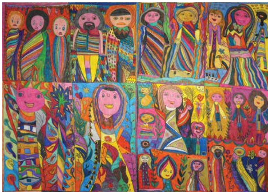
Rosalina Aleixo Grande Famille 100 x 140 cm