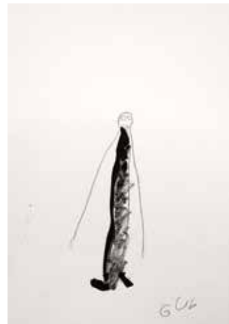
Guy Vonlanthen Sans titre 30 x 21 cm

Fondé en 1998 à Fribourg, l'atelier CREAHM est une association dont l'objectif est de développer et de révéler des formes d'art produites par des personnes en situation de handicap mental.