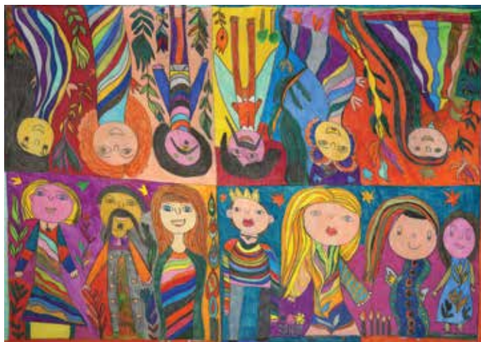
Rosalina Aleixo Famille 70 x 100 cm