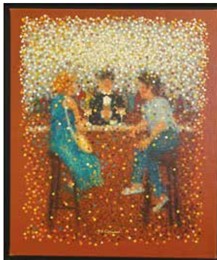
Marie-Gabrielle Carrassan Cocktail bar 46 x 55 cm