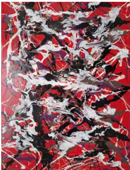
Daniel Collin Aller vers le futur Acrylique, finition vernis à l'eau 60 x 80 cm