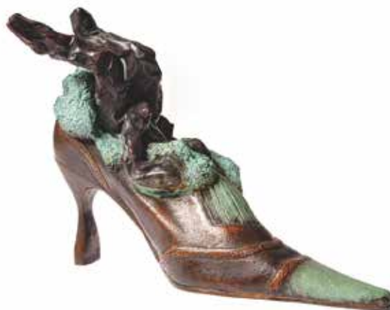
SCARPA DONNA ... dove nascono le ragazze