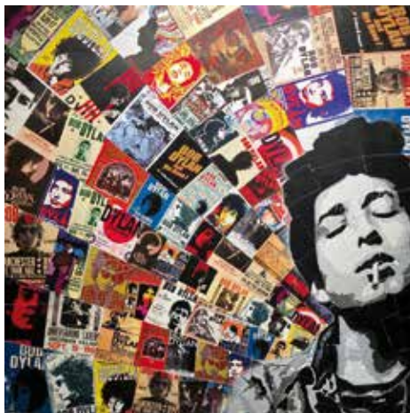
Reno Dylan Acrylique, posca, collage 48 x 48 cm