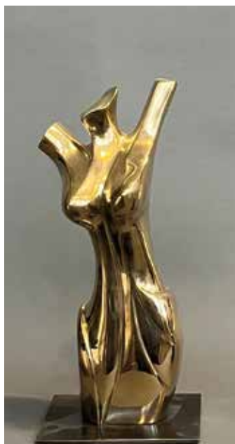
Franceleine Debellefontaine Utopie Bronze poli miroir | 21 x 10 x 8 cm