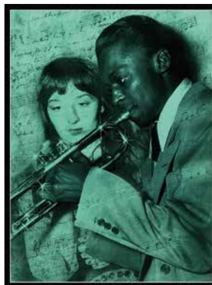
Décomposition d'une photo de Miles & Juliette Technique mixte 55 x 74 cm