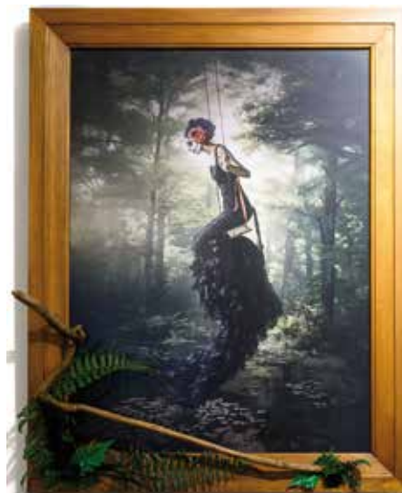
Equilibrio con los ciclos de la madre tierra

Techniques mixtes sur tableau photogra- phique 58 x 73 cm