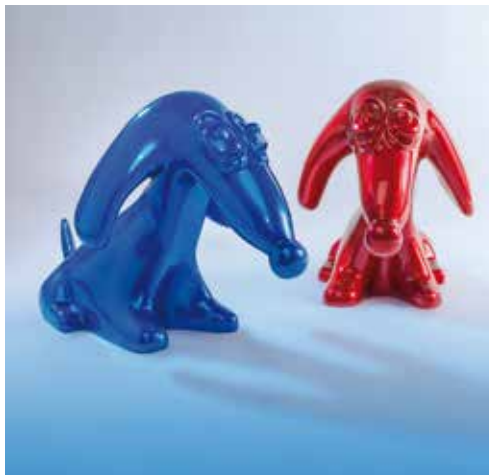
Serge Gauya Blue Dog Resine sculpture Disponible dans différentes tailles