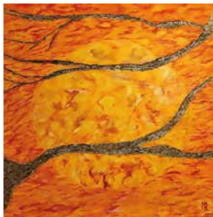
MK Solar Deluge 80 x 80 cm