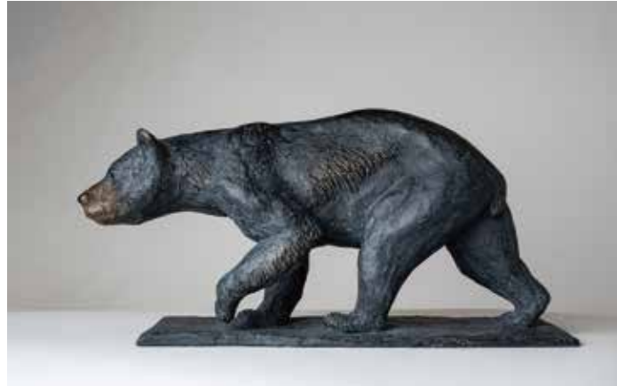
Christine Despraz Ourse noire en marche Bronze 14 x 28 x 2 cm