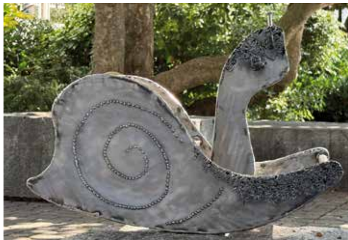
Raphy Buttet Je me souviens 7 souvenirs d'enfance usés par le temps Créations en métal