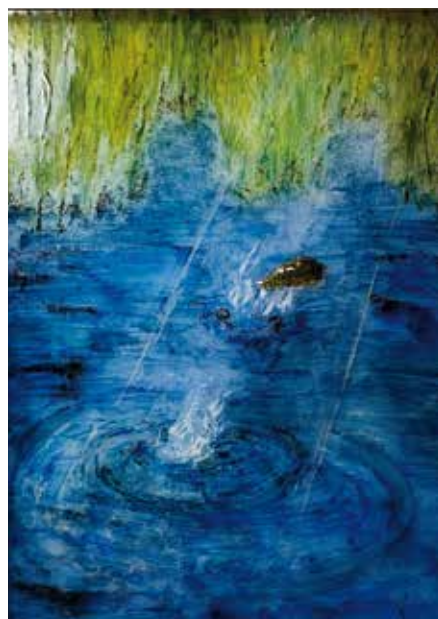
Elizabeth Rossi Ricochet Huile sur toile 66 x 88 cm