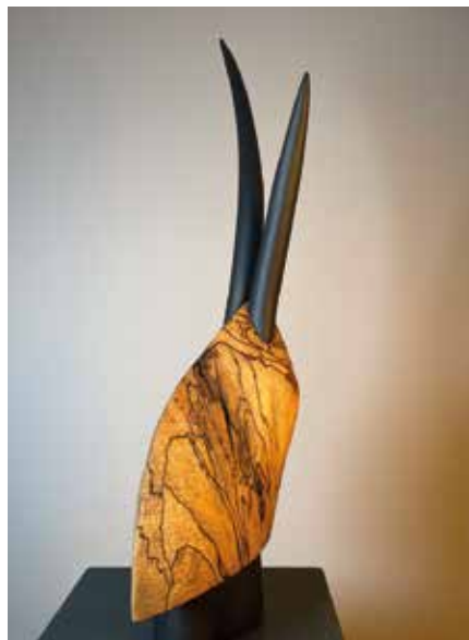
François Luzac 2027 Bois 65 x 20 cm

Basés sur la Riviera vaudoise, nous mettons notre savoir-faire au service de projets qui allient exigence artistique, convivialité et ouverture à tous.