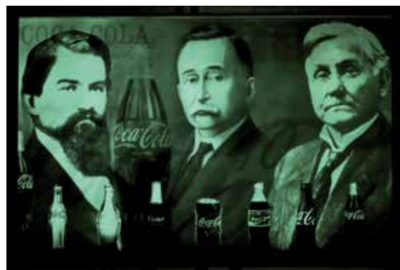
Apparition dans la nuit des protagonistes de Coca-Cola Technique mixte 78 x 60 cm