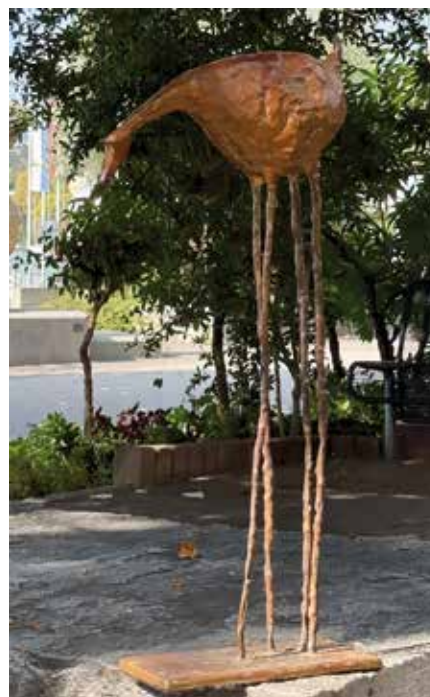
Kim Boulukos Horse looking down Bronze