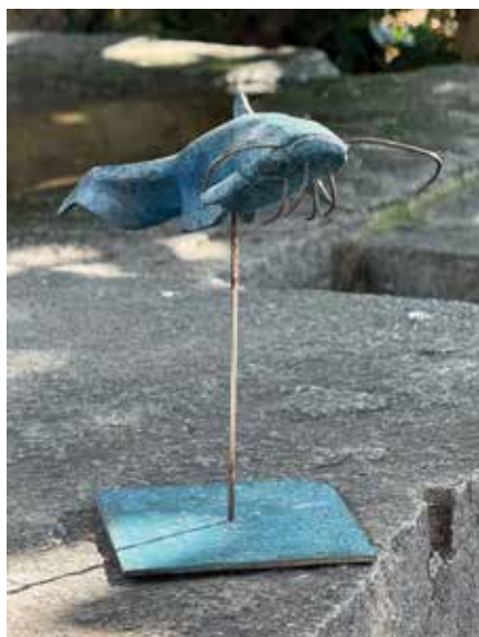
Gaël Lavorel Silure Bronze