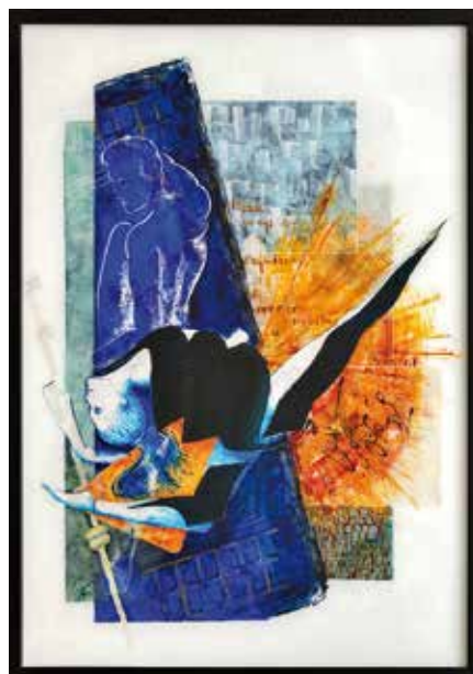
Isabelle Contini Se réécrire Peinture au revers du verre 60 x 80 cm