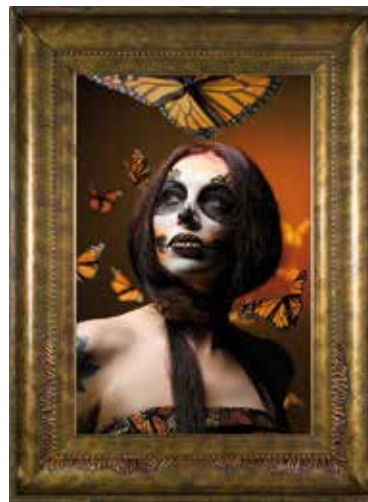
Donde el Oyamel Abraza a las Mariposas

Techniques mixtes sur tableau photographique 76 x 105 cm