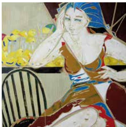
Martine Delaleuf L'année des citrons Huile sur toile de lin 80 x 80 cm