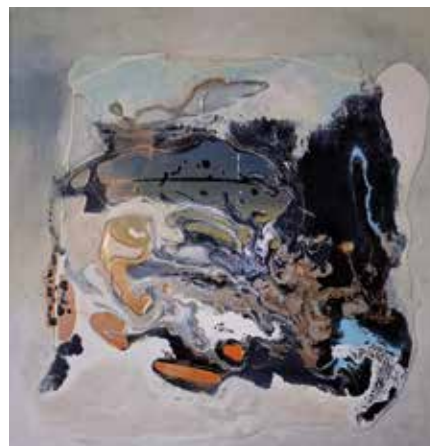
L'univers en cavale Technique mixte 60 x 60 cm