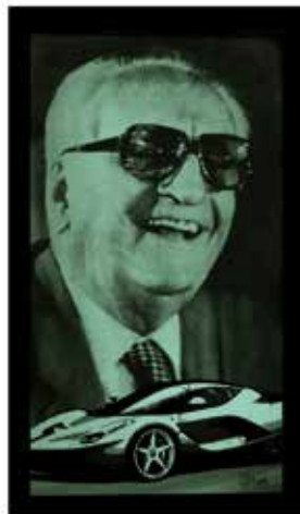
Il Commendatore Enzo Ferrari Technique mixte 40 x 72 cm