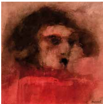
Palmi Mazarolli Regard sur la folie Encre 29 x 29 cm