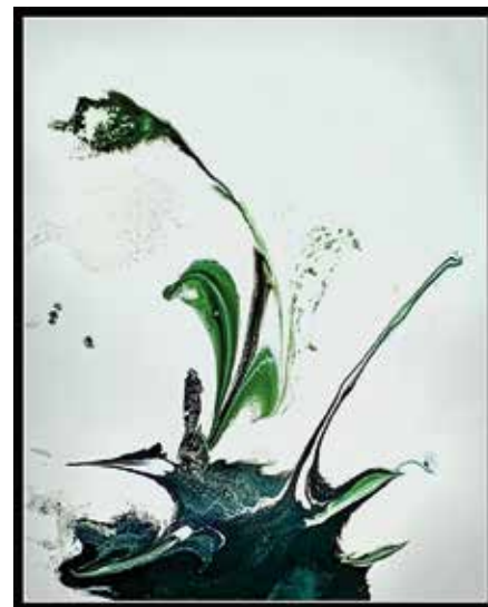
Exploration 08 Technique mixte 60 x 78 cm

Mes tableaux, au procédé hors du commun, offrent à la lumière du jour une première vision sous forme de patchwork photographique ou pictural. Dans l'obscurité, une apparition totalement invisible se révèle sur le même tableau, grâce à la technique de l'image luminescente dont j'ai développé la technique.