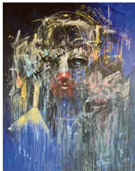
Lemmy Gonthier Chaos Acrylique sur toile 80 x 100 cm