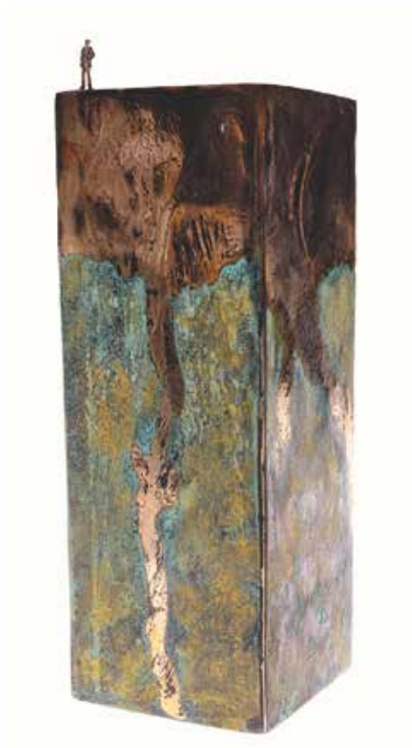
SOLO Bronze numéroté 2/8 et argent 925 Fonderie Tassis Athènes