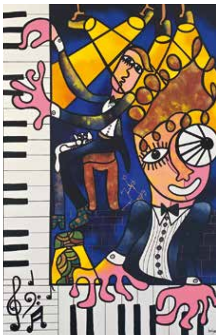
Karine Brüger Les 4 mains Acrylique et encre de chine 65 x 100 cm