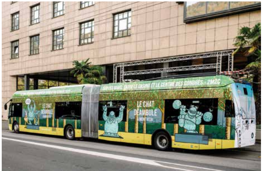
Fondation MAG – Le Chat déambule – 2022

Le Prix VMCV, remis à l'issue du salon, offrira à l'artiste lauréat l'intégralité des ventes des tirages et cartes postales présentés, ainsi qu'une visibilité exceptionnelle grâce à un bus à habiller en 2026.