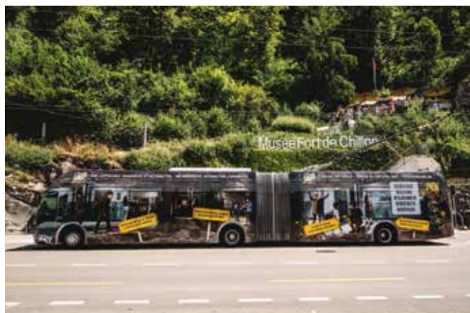
Musée Fort de Chillon – 2025