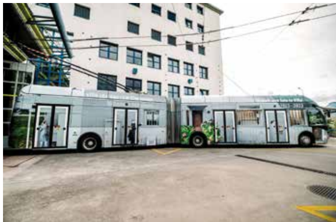
Villa « Le Lac » Le Corbusier – 2023