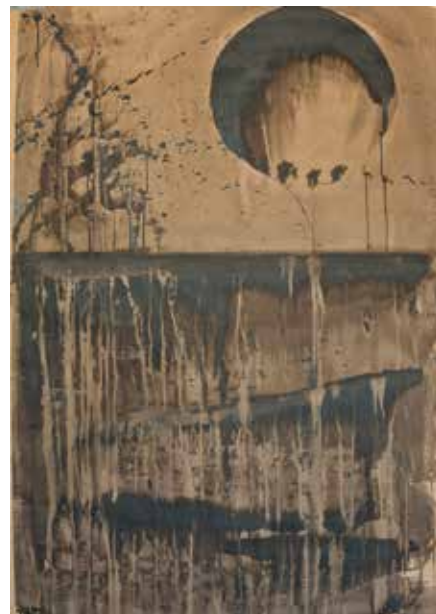
Sans titre Fusain, pastels secs, pastels gras, 86 x 122 cm

Le Studio 6A fait partie du Jardin Culturel de Malévoz, un ensemble d'ateliers d'insertion socioprofessionnels situé dans le parc de l'hôpital psychiatrique de Monthey.