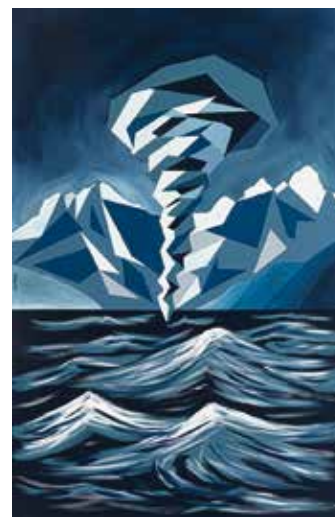
Ivan Micello Tornado géométrique Peinture minérale recyclée sur toile 100 x 150 cm