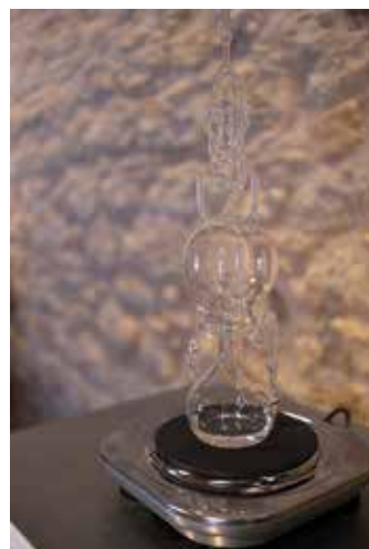
Ce que l'eau nous murmure