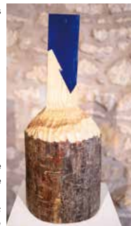
Mémoire de la matière