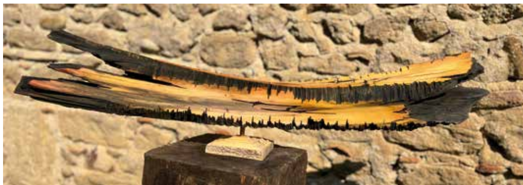
Alexandre Berlioz Fragment III Noyer / buis 35 x 20 x 105 cm