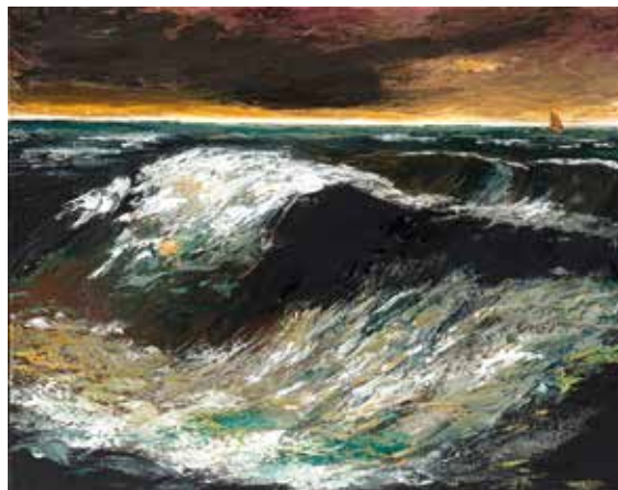
Sophie Bourgon La vague Huile sur toile 93 x 72 cm

La dernière édition s'est déroulée du 19 au 21 septembre 2025. En seulement trois jours, 30 peintres se sont confrontés au thème «la tempête» pour réaliser une œuvre dans l'espace public. Les 8 tableaux primés rejoignent les espaces d'exposition du salon MAG.