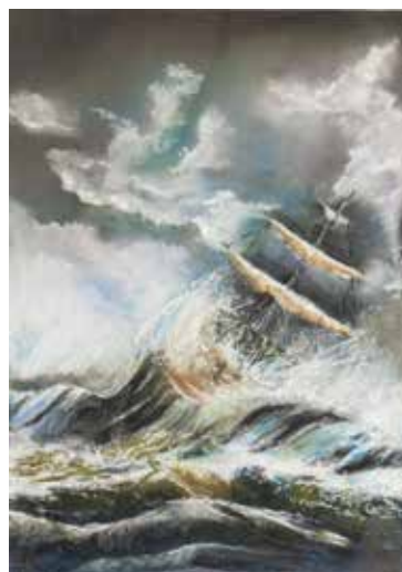
Edwige Wozny Éléments déchainés Pastel sec 30 x 40 cm