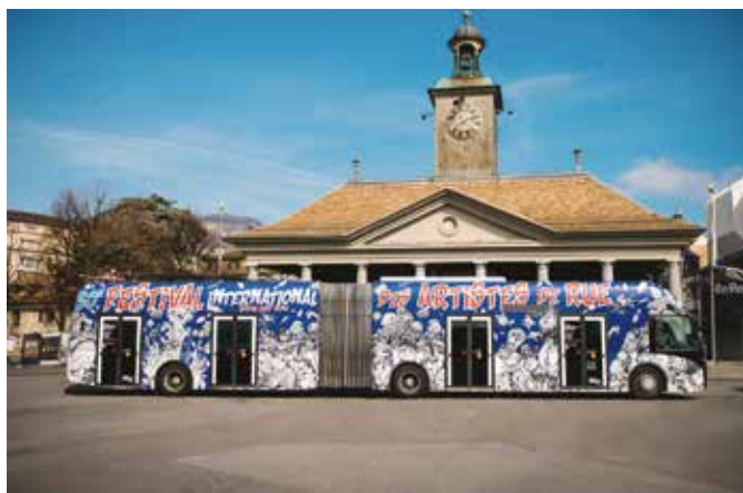
Festival International des Artistes de rue – 2024