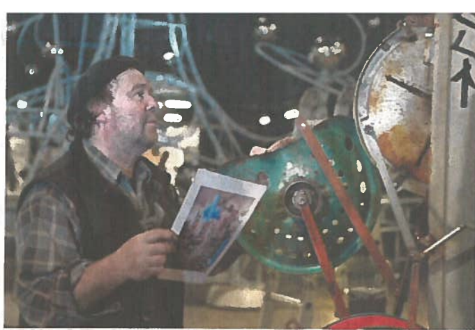
Le sculpteur allemand Willi Reiche est tout heureux de se trouver dans une telle concentration d'artistes cinétiques.