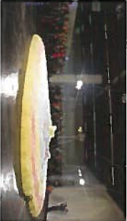
Bloom 2014

Du 24 au 27 septembre Cologne www.art-fair.de www.bloom.de