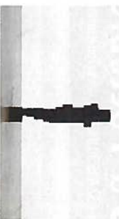
A Somley

La Fiac est l'une des plus importantes foires d'art contemporain qui se tient chaque année à Paris, dans le splendide cadre du Grand Palais. Pour sa 42e édition, la foire réunira sous son toit, pas moins de 173 galeries provenant de 23 pays différents. En parallèle, la foire « Officielle » se tiendra aux Docks et sera consacrée à des jeunes galeries. Et comme à l'accoutumée, la programmation « Hors les Murs » continuera à surprendre le public en présentant dans des lieux parisiens un parcours d'œuvres en extérieur. Une petite nouveauté, le Musée en Seine, consistera en un circuit fluvial entre des lieux d'expositions situés aux abords de la Seine, allant de la Maison de la Radio à la Bibliothèque nationale de France.