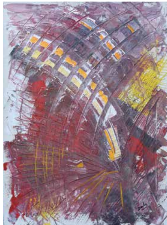
Sans titre Huile sur toile 54 x 70 cm