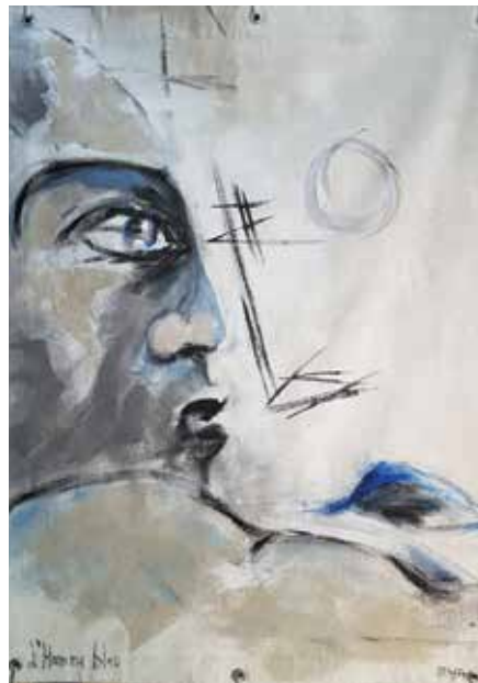
Liberté des mers 2 L'homme bleu