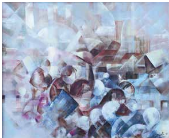
La grève des mineurs Huile sur toile 70 x 55 cm