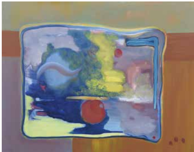
Sans titre Huile sur toile 91 x 72 cm