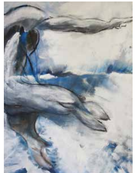
Liberté des mers 3