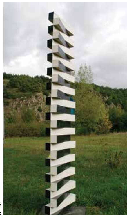
Contraste 220 x 47 x 7 cm

De manière plus générale, je tiens à représenter ce qui est indispensable au développement du vivant, l'Eau comme matière, l'œuf comme forme idéal, la ligne hélicoïdale est là pour signifier la force du végétal et l'extraordinaire structure du filament d'ADN qui se trouve dans chaque cellule vivante.