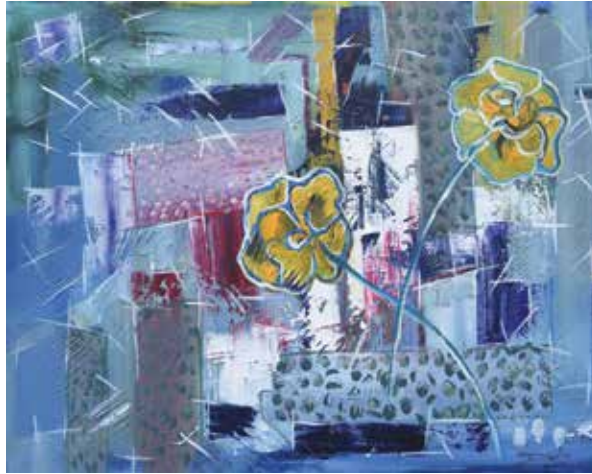
Où sont nos enfants Huile sur toile 92 x 73 cm