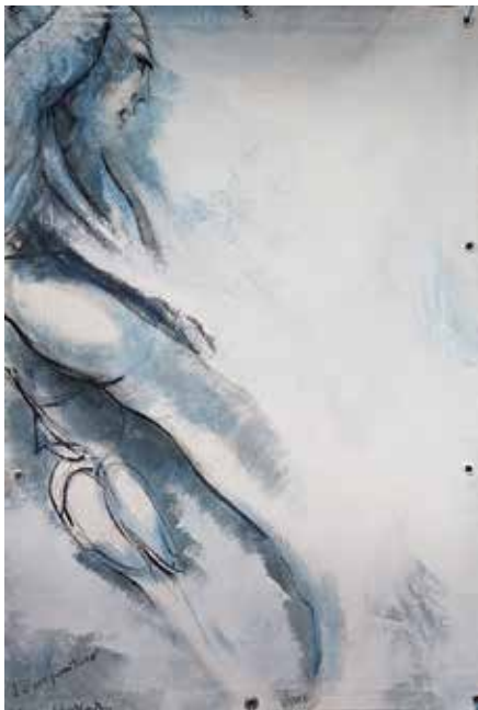
Liberté des mers 1 La non pesanteur