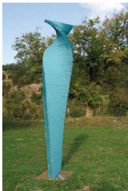
Silouhette 220 x 47 x 7 cm